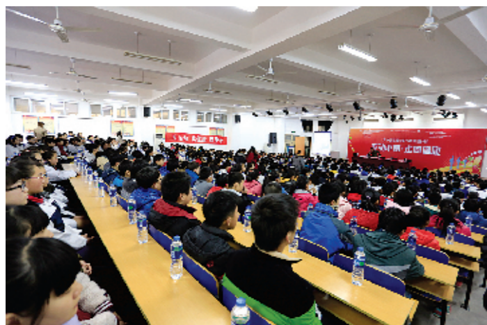
互动频频的知识共享活动